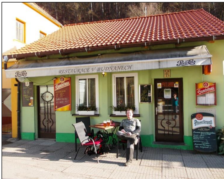
Závěrečné posezení pod Karlštejnem