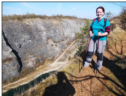
lom Velká Amerika

Při cestě kolem Velké Ameriky jsem si prošla stezkou odvahy. Stezka totiž vedla těsně nad hranicí lomu... nic pro nás, kteří mají ve výškách závratě... došli jsme na parkoviště před lomy. Bylo tu plno. Samá pražská SPZ. Kolem lomů jsme potkávali docela dost lidí a hodně jsme tam vyčnivali. Což pak vlastně celou cestou až ke Karlštejnu. My v tričkách, rozduchaní větrem a lehce od bláta. Ostatní v zimních bundách, kulichy, boty na podpatcích, přemíra parfémů,... chjo. Vzali jsme to rychle přes Mořinu zpět do přírody, ještě alespoň na chvíli. Ke Karlštejnu jsme tak přišli zadem po červené a ne po silnici, jako ostatní.