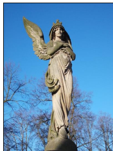
Kostel Božího těla s hřbitovem na vrchu Oreb